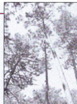
La forêt de Pinia

De son côté, le PNRC a réalisé en 2009 220 sorties avec des scolaires pour 3118 élèves, et 13 sorties grands publics pour 356 personnes.